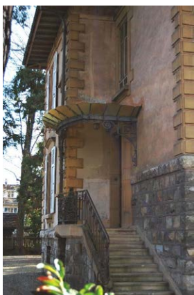
Façade nord-est, entrée