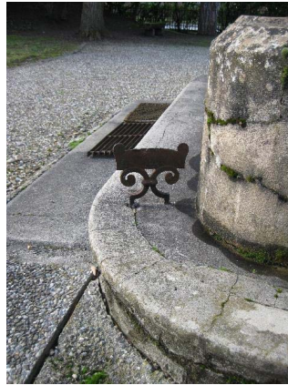
Détail perron, décroitoir