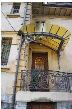
Façade nord-est, entrée, marquise Art nouveau