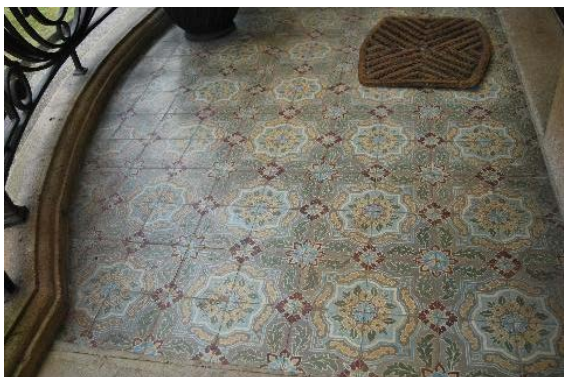
Entrée nord-est, détail carrelage du perron