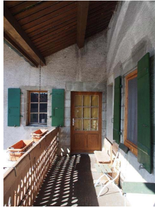
Façade sud-ouest, porte et fenêtre du premier étage, depuis l'escalier en bois (bât. 175)