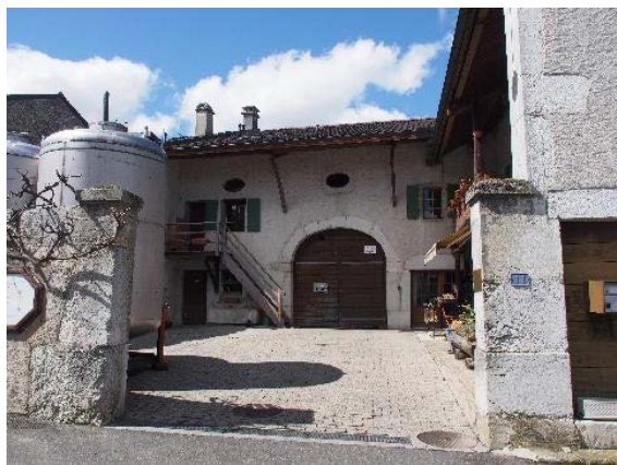
Façade sud-est (bât. 175)