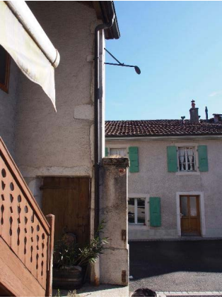
Façade nord-ouest, mur coupe-vent (bât. 174)