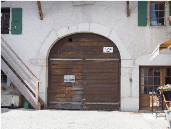
Façade sud-est, porte cochère (bât. 175)