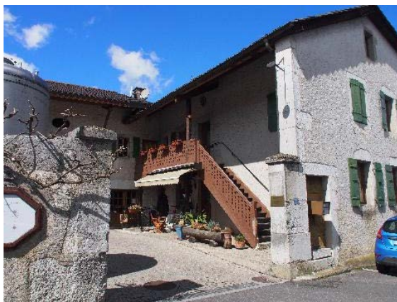
Façade sud-ouest, escalier extérieur avec garde-corps en bois découpé (bât. 174)