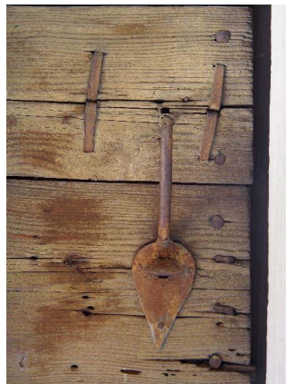
Façade sud-est, serrure de porte (bât. 174)