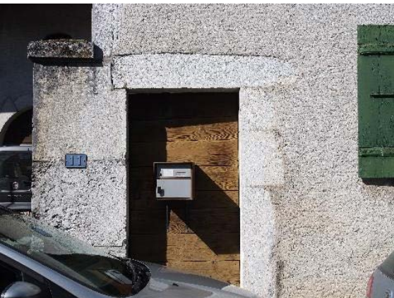
Façade sud-est, porte (bât. 174)