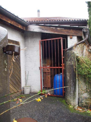
Façade nord-ouest, mur avec millésime (bât. 176)