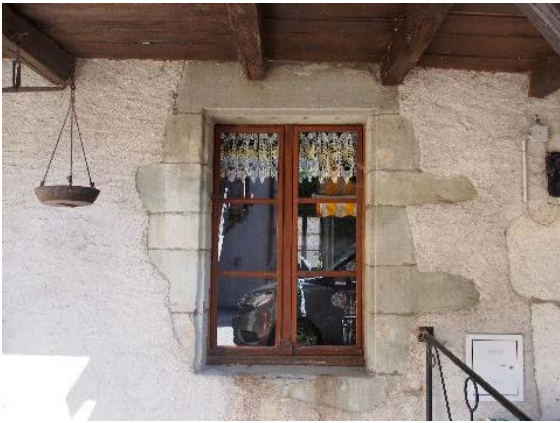
Façade sud-ouest, fenêtre du rez-de-chaussée sous l'escalier (bât. 174)