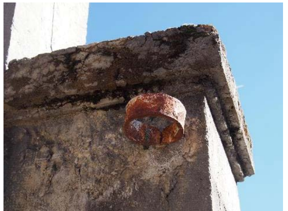
Façade sud-est, anneau métallique scellé dans le montant (bât. 174)