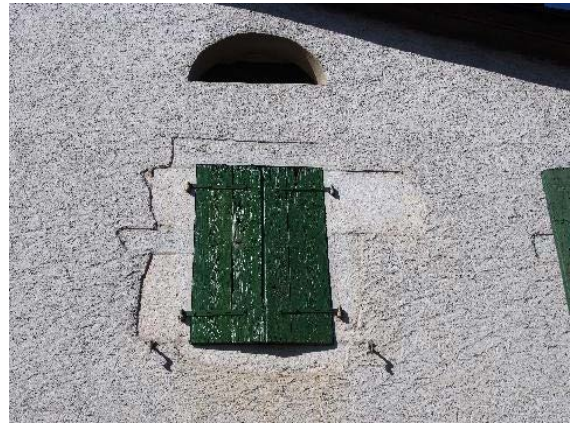
Façade sud-est, fenêtre du deuxième étage et baie de ventilation (bât. 174)