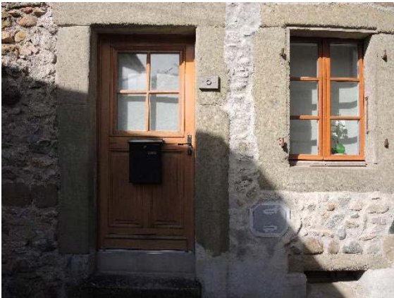
Façade est, entrée