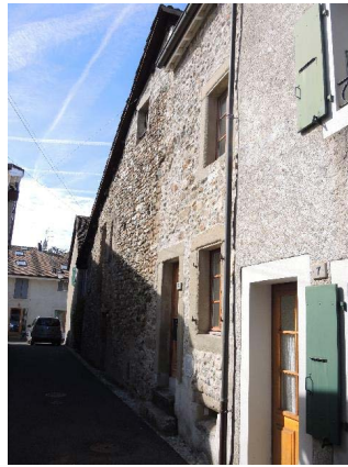
Centre 3-5-7, façades est