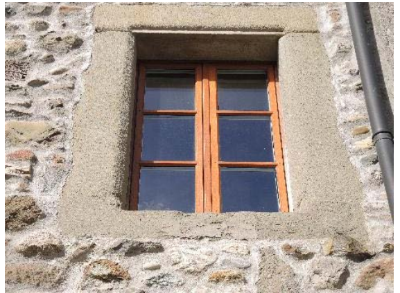
Façade est, fenêtre