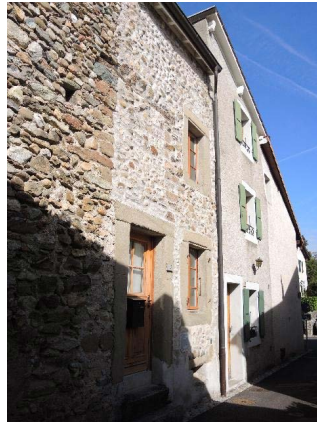
Centre 3-5-7 et Nord 25, façades est