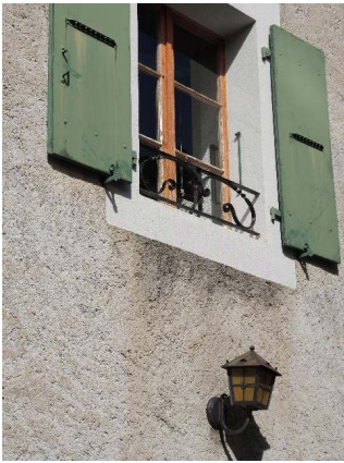
Façade est, fenêtre