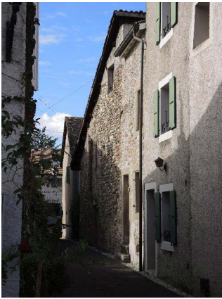
Centre 3-5-7, façades est