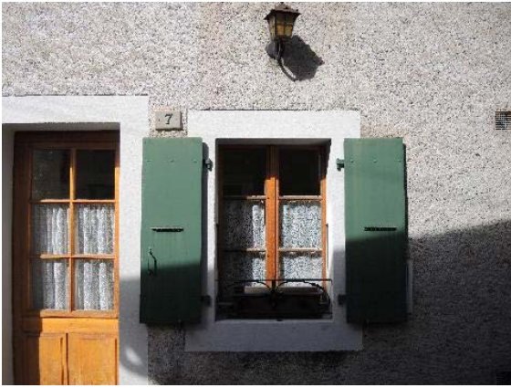
Façade est, fenêtre