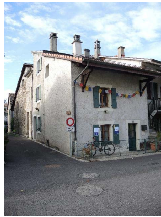
Centre 3-5-7 et Nord 25, façades est et nord