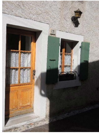
Façade est, entrée