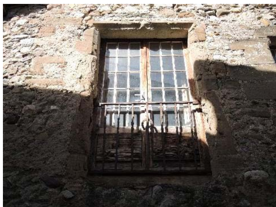
Façade est, fenêtre