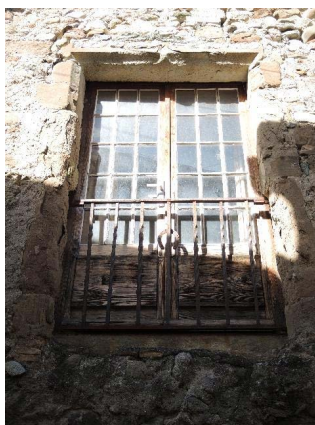
Façade est, fenêtre