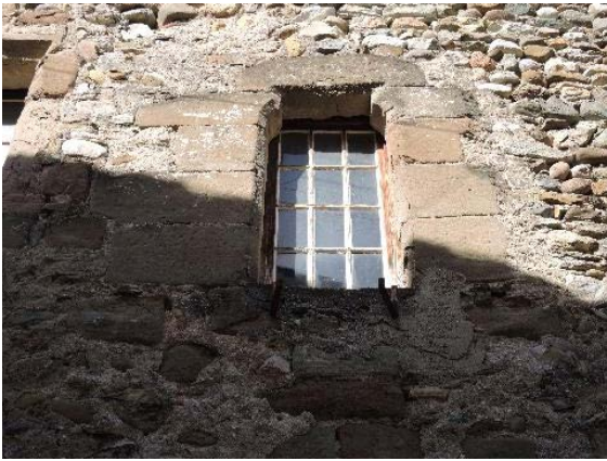
Façade est, fenêtre