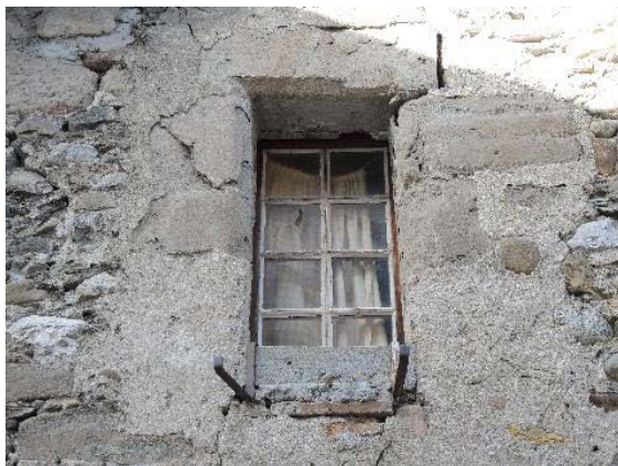
Façade est, fenêtre