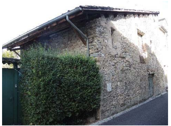
Façades sud et est