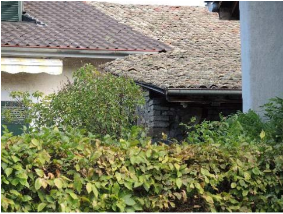
Façades nord et sud