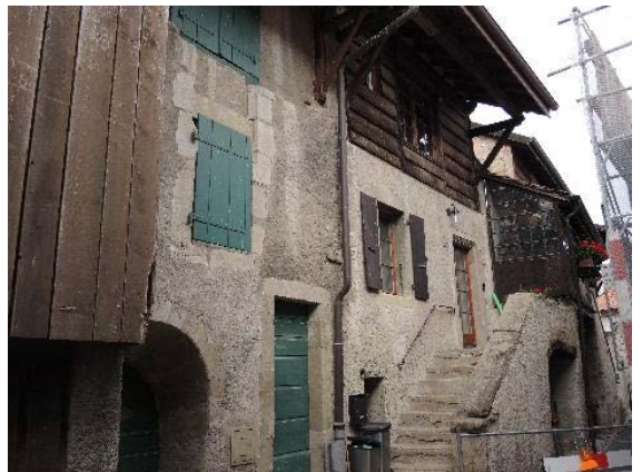
Galleries 7-9, façades est