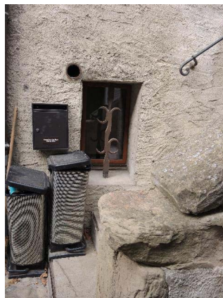
Façade est, , soupirail