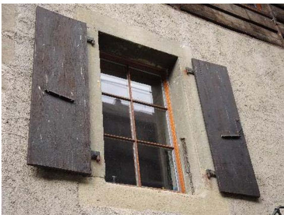
Façade est, fenêtre