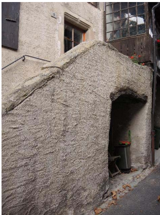
Façade est, escalier d'accès et accès rez-de-chaussée