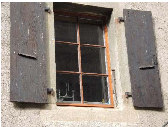
Façade est, fenêtre