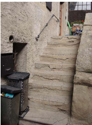
Façade est, escalier d'accès