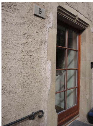
Façade est, fenêtre, linteau en accolade