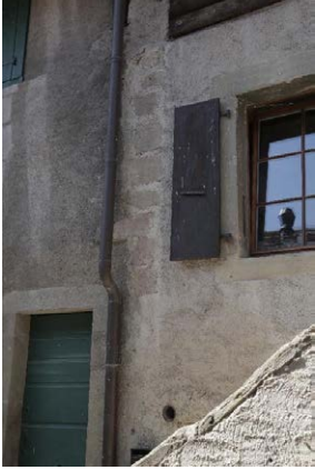
Façade est, chaîne d'angle