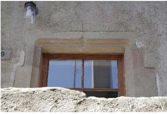
Façade est, détail du linteau de la porte