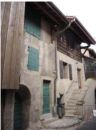
Galleries 7-9, façades est