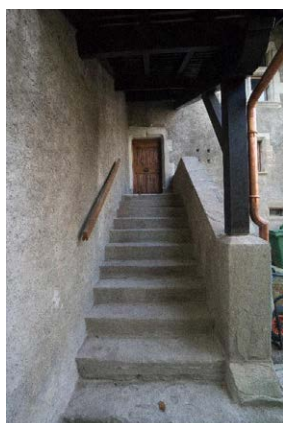
Façade nord, détail de l'entrée, escalier extérieur