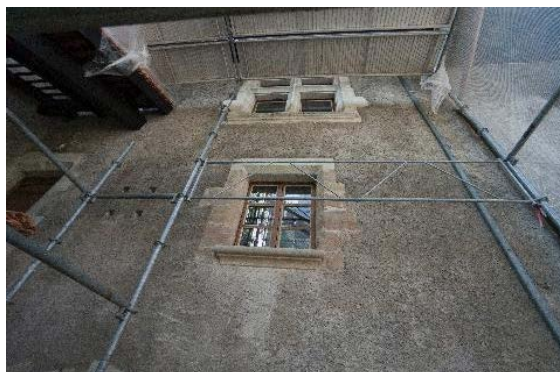
Façade nord, détail de l'avant-toit, baies