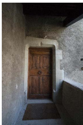
Façade nord, détail de la porte d'entrée