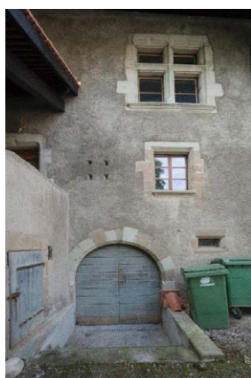
Façade nord, détail de baies, encadrement