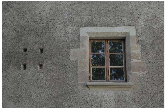
Façade nord, détail