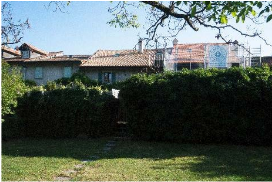
Façade sud (rue du Midi 15-19)