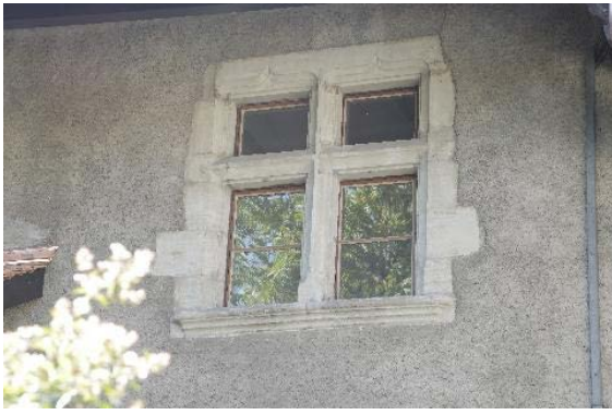
Façade nord, détail de la baie à croisée