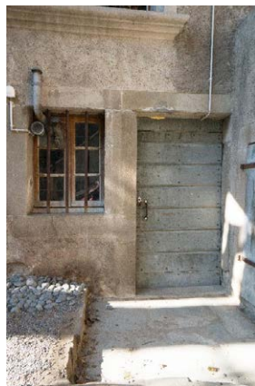
Façade nord, détail de la porte de l'ancienne écurie