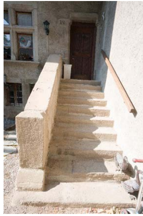
Façade nord, détail de l'entrée, escalier extérieur