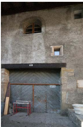
Façade nord, détail de la porte de remise, baies