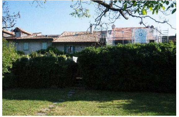
Façade sud (rue du Midi 15-19)