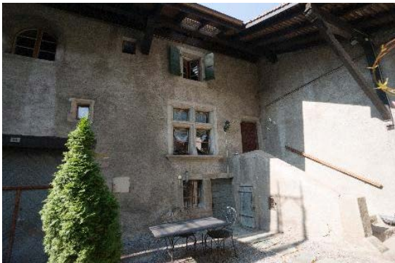
Angle nord-ouest, détail de l'avant-toit, baies