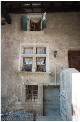
Façade nord, détail de baies, encadrement