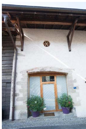
Façade nord, détail de l'ancienne porte de grange, baie