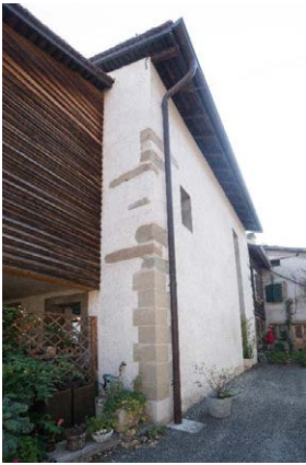
Angle sud-ouest, détail