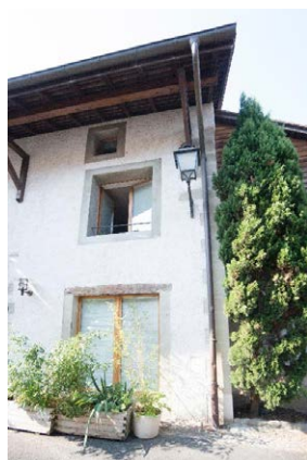
Angle nord-ouest, détail de l'avant-toit, baies