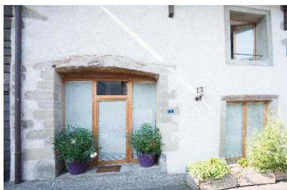
Façade nord, détail de baies