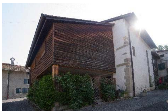
Façades sud et ouest