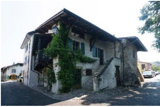
Façades sud et ouest (ruelle des Galeries 2-4 et rue du Midi 30-32)