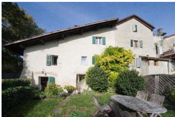
Façade est, jardin