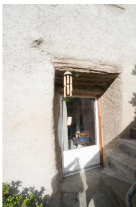
Façade est, détail de baie