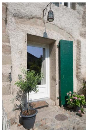
Façade est, détail de l'entrée