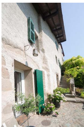
Façade est, détail