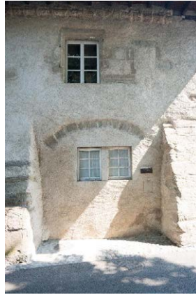
Façade sud, détail de baies