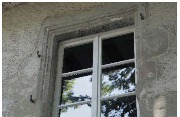
Façade sud, détail