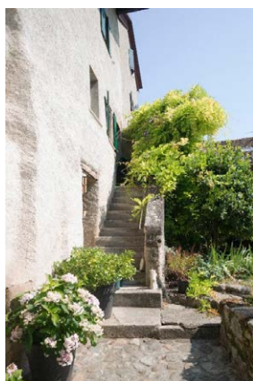
Façade est, détail de l'escalier extérieur