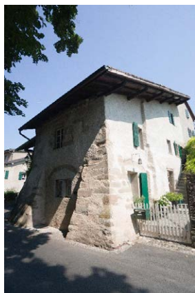
Façades sud et est