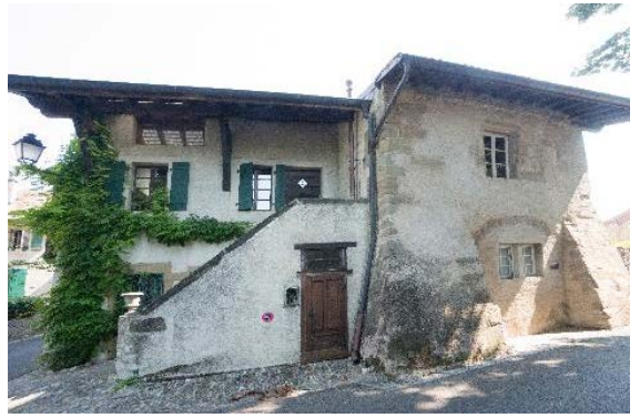
Façade sud (ruelle des Galeries 2 et rue du Midi 30-32)