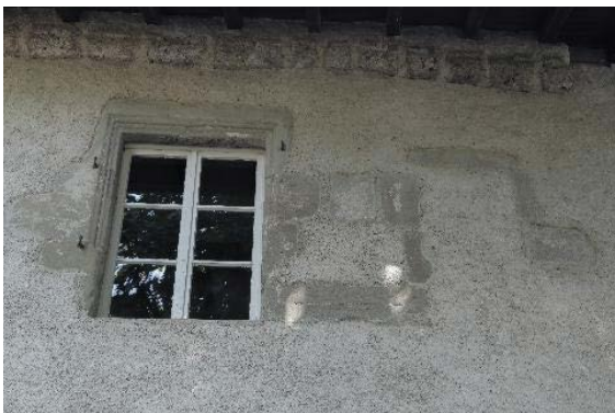
Façade sud, détail