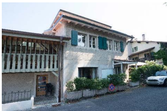
Vue vers l'est