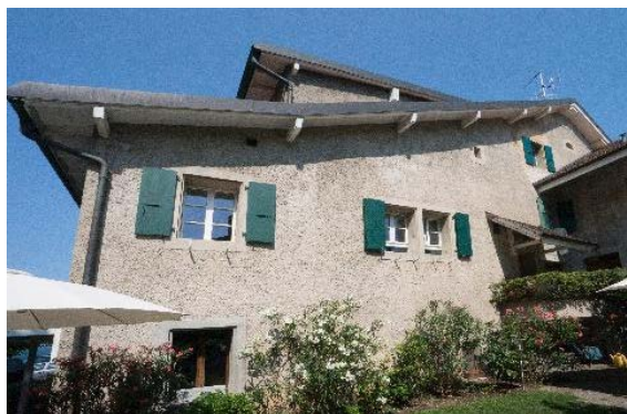
Façade est (à droite ruelle des Galeries 3 et à gauche rue du Midi 34)