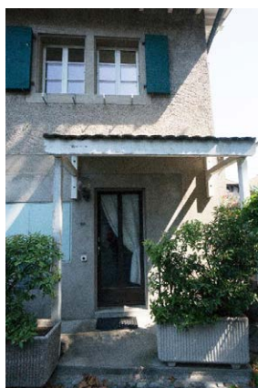
Façade sud, détail de l'entrée