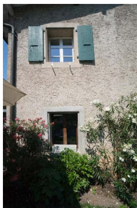
Façade est, détail de baies