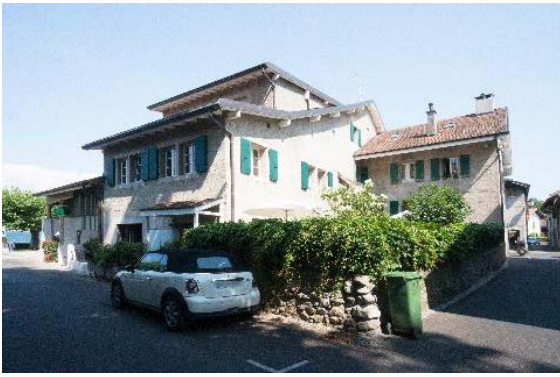
Façades sud et est (ruelle des Galeries 3-5 et rue du Midi 34)