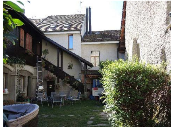
Nord 9, façade ouests, Centrale 14-16, façades nord et Nord 13, façade est