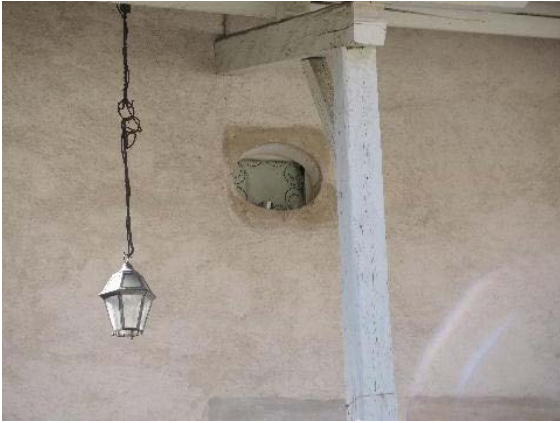
Façade nord, baie et luminaire