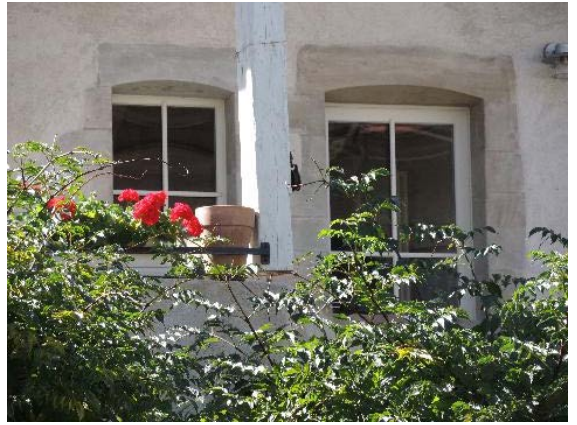
Façade nord, fenêtre et entrée