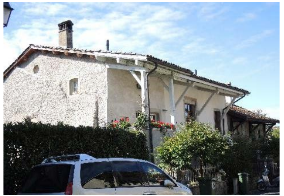
Nord 13-15-17, façades nord et est