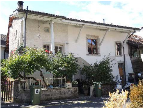
Nord 13-15-17, façades nord