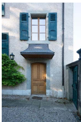
Façade nord, détail de l'entrée