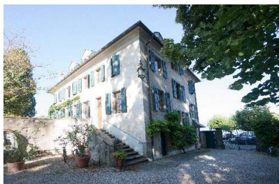
Façades nord et est, jardin