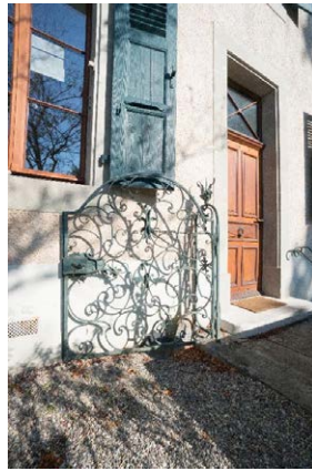
Façade est, détail de la porte en ferronnerie