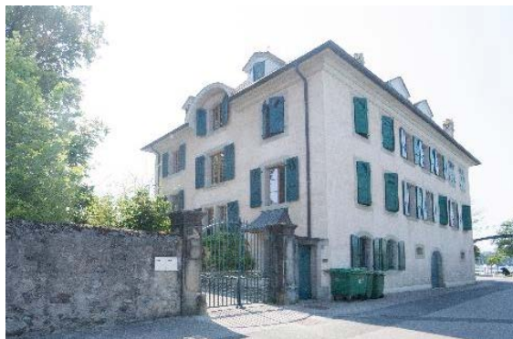
Façades nord et ouest, muret et portail

Plan publié dans Bujard 1997, avec mise en évidence de la tour médiévale et des fortifications