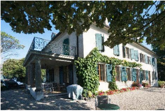
Façades sud et est