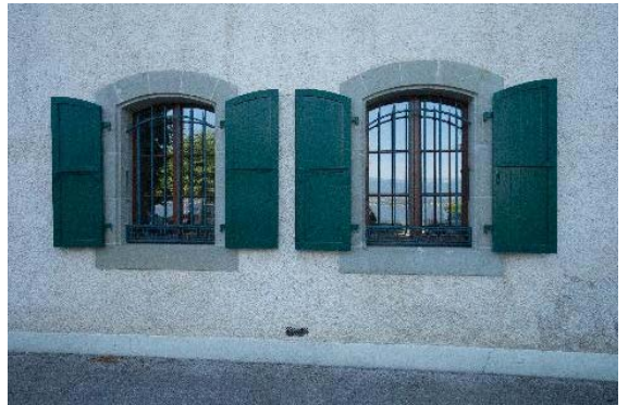
Façade ouest, détail de baies