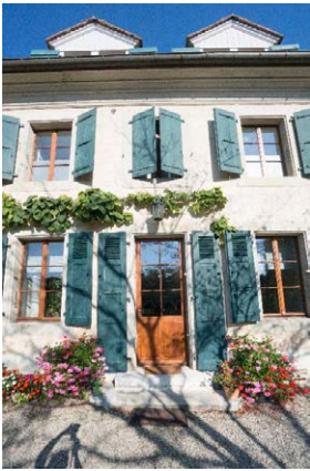
Façade est, détail de baies, lucarnes