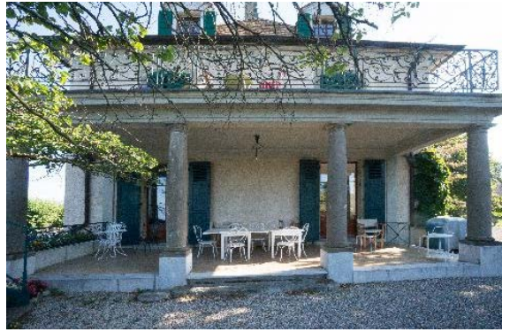
Façade sud, détail