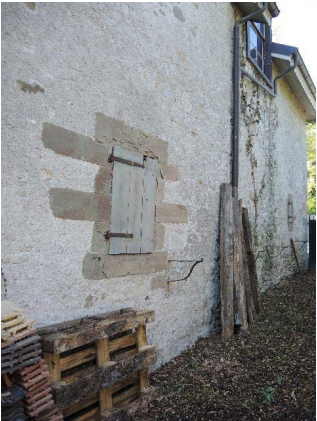
Dépendance, bât. 60, façade nord-est