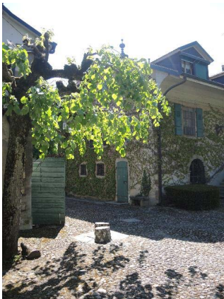
Façades nord-est et nord-ouest