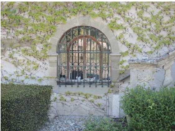
Façade nord-ouest, fenêtre rez-de-chaussée