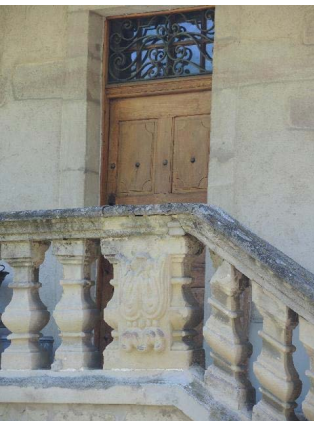
Façade nord-ouest, porte d'entrée