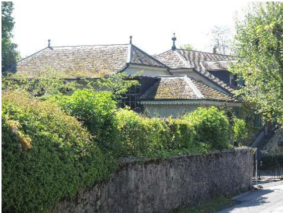
Toitures, vue d'ensemble