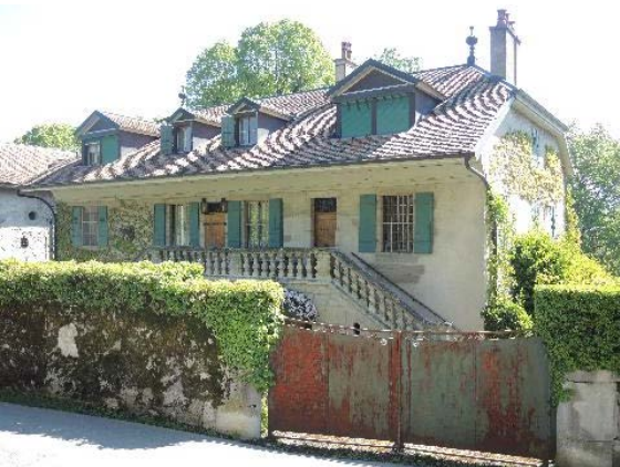
Façades nord-ouest et sud-ouest