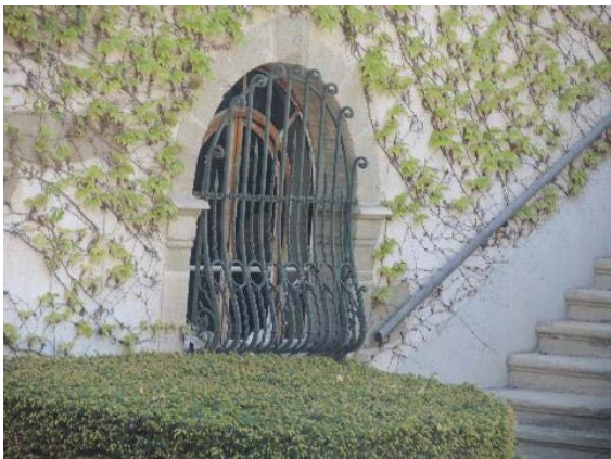
Façade nord-ouest, fenêtre rez-de-chaussée