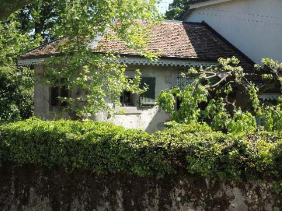
Dépendance, bât. 60, façades nord-ouest et sud-ouest