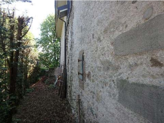
Dépendance, bât. 60, façade nord-est