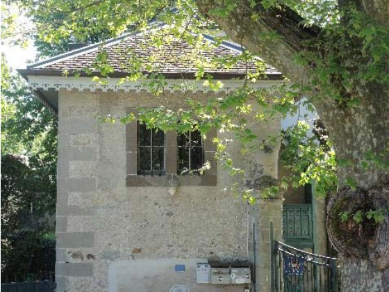
Dépendance, bât. 60, façade nord-ouest