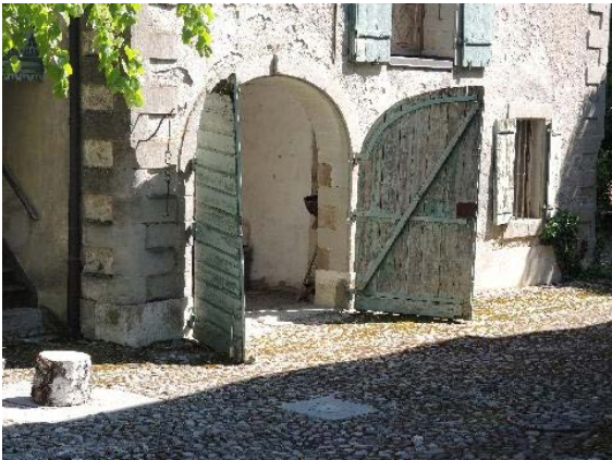
Dépendance, bât. 60, façade sud-ouest, porte cochère