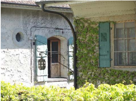
Dépendance, bât. 57, et maison de maître, bât 50, lampe