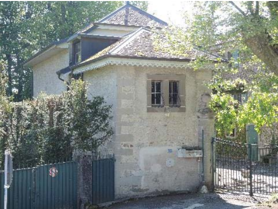
Dépendance, bât. 60, façades nord-est et nord-ouest