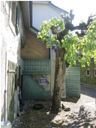
Dépendance, bât. 60, façade sud-ouest, escalier extérieur