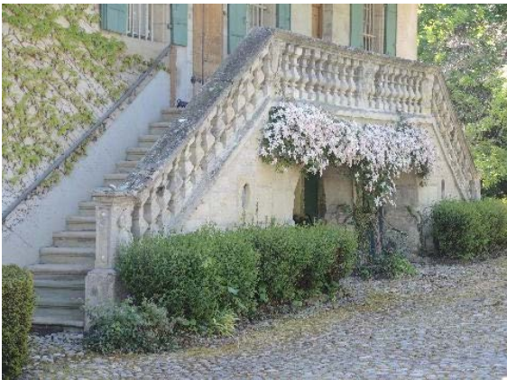
Façade nord-ouest, perron