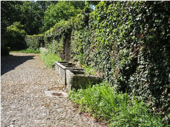
Cour et fontaines