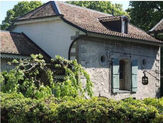
Dépendance, bât. 60, façades nord-ouest et sud-ouest