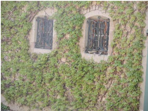
Façade nord-est, fenêtres rez-de-chaussée