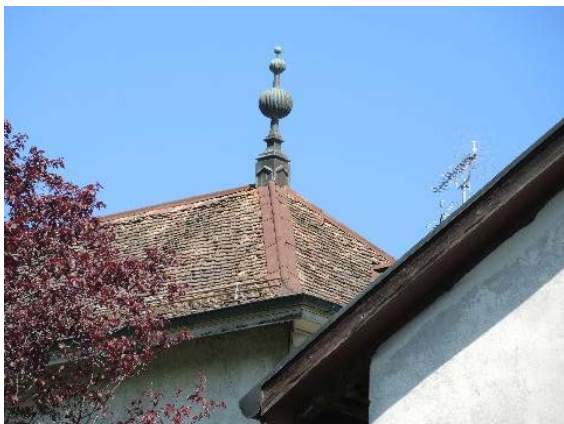
Epi de faitage