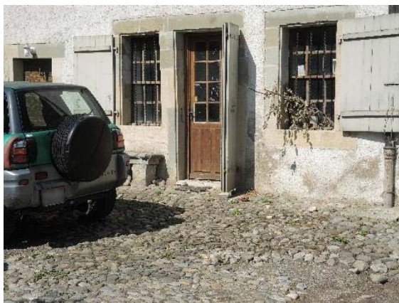
Façade sud-est, détail porte et avant-cour