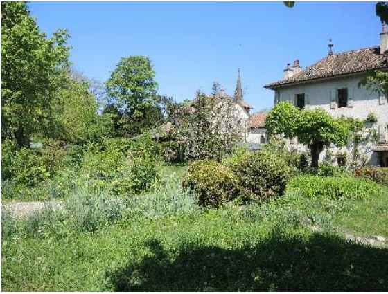
Façade sud-ouest et jardin sud