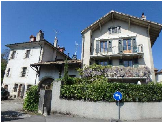
Peutets 4, façade sud-est et place de Vandoeuvres 8, façade sud-est