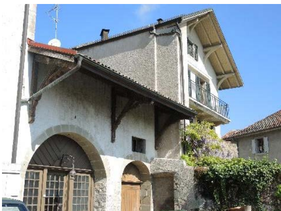
Peutets 4, façade sud-est et place de Vandoeuvres 8, façade sud-est