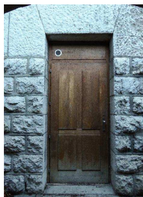
Façade nord-est, porte d'entrée au sous-sol