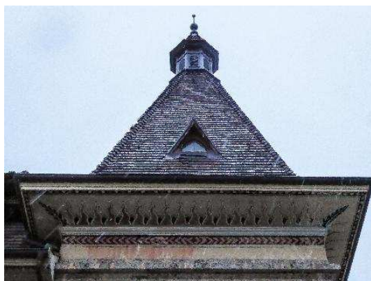
Façade nord-ouest, partie supérieure