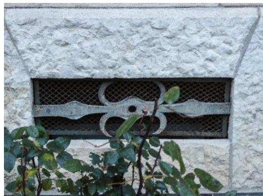
Façade nord-ouest, soubassement, vasistas