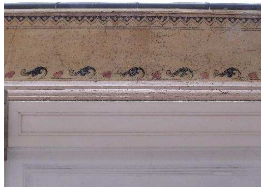
Façade sud-ouest, détail de la fermeture d'avant-toit