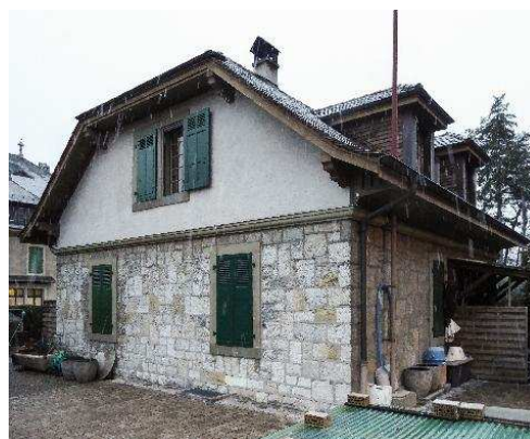
Dépendance, façades nord-ouest et nord-est