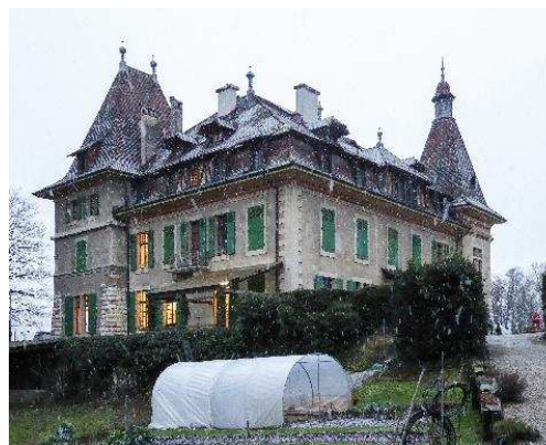
Façades nord-est et nord-ouest