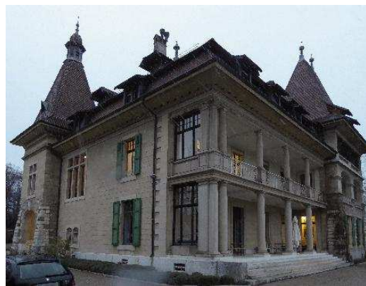
Façades sud-ouest et sud-est