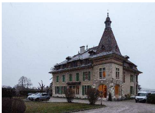
Façades nord-ouest et sud-ouest