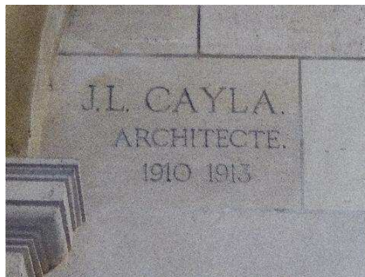
Angle ouest, porche d'entrée, inscription et millésime