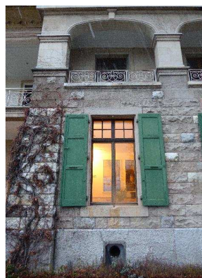
Façade sud-est, rez-de-chaussée et 1er étage, détail d'une travée