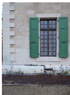
Façade nord-ouest, rez-de-chaussée, détail chaîne d'angle et fenêtre