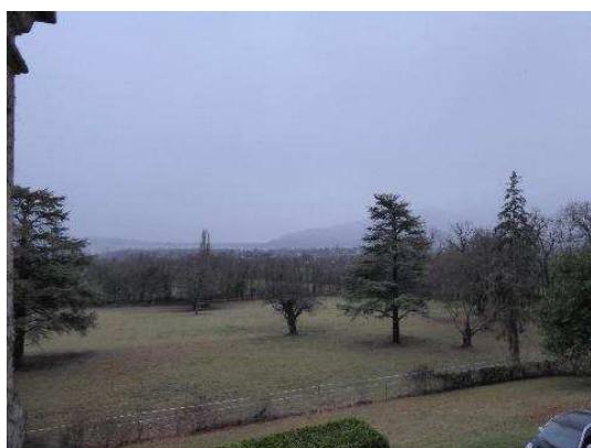
Jardin, vue en direction du sud-est