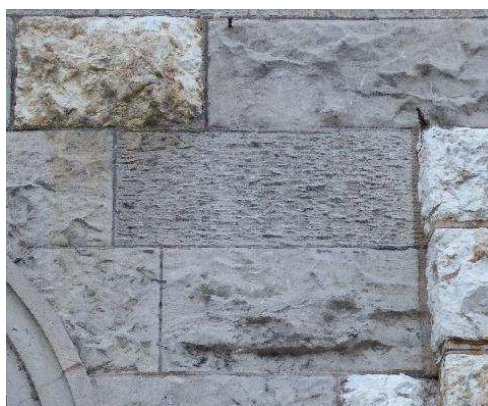
Façade nord-ouest, rez-de-chaussée, détail de l'appareil de pierre