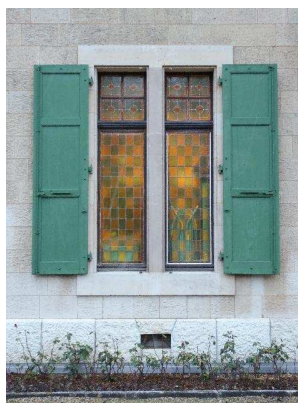
Façade nord-ouest, fenêtre