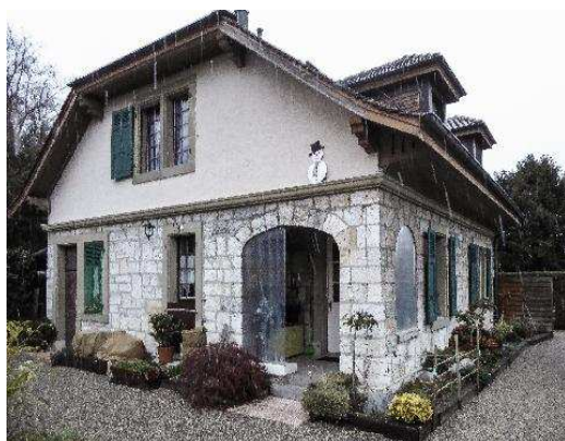
Dépendance, façades sud-ouest et sud-est