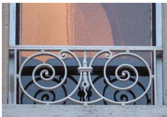
Façade nord-ouest, 1er étage, garde-corps de fenêtre en fer forgé