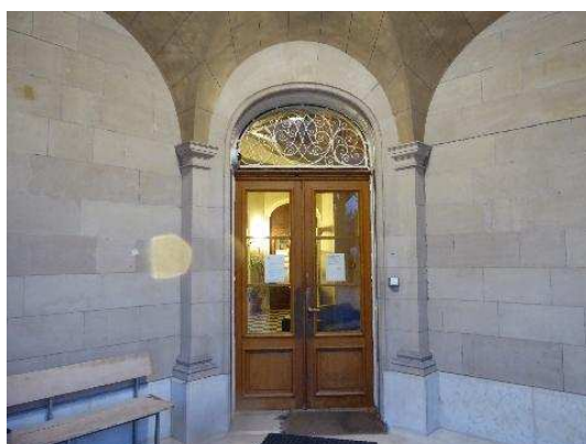
Angle ouest, porche d'entrée et porte