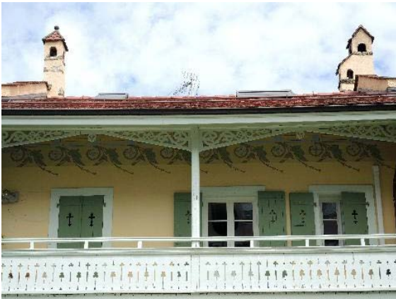
Façade sud-ouest, détail boiseries et frise peinte