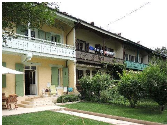
Anémones 10-8, De-Maisonneuve 27, Anémones 4, façades sud-ouest