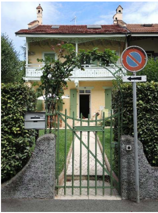
Façade sud-ouest et portail