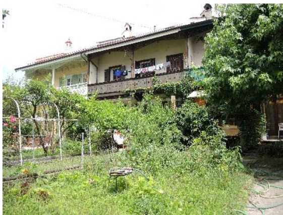
Anémones 10-8-De-Maisonneuve 27, façades sud-ouest et jardin Anémones 8