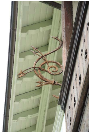
Façade sud-ouest, détail ferronnerie de partition entre Anémones 10 et 8