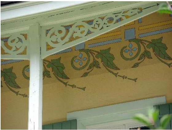
Façade sud-ouest, détail boiseries et frise peinte