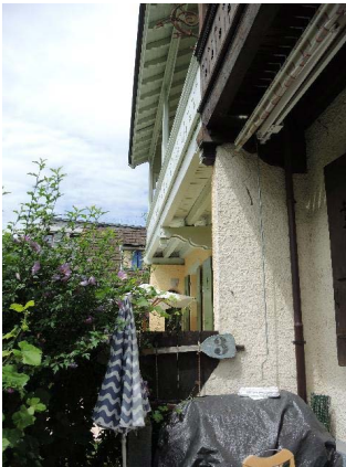
Détail sous toiture façade sud-ouest (Anémones 10, à gauche)