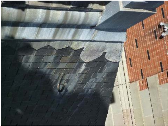
Toit, détail éléments de ferblanterie