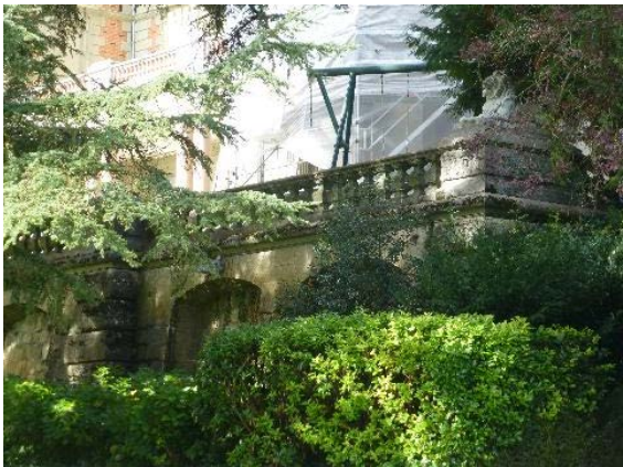
Terrasse (à l'est de la maison de maître), vue de l'angle nord-est