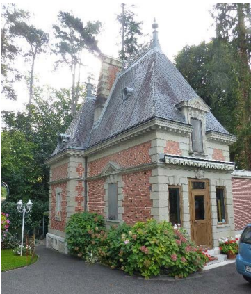
Loge de gardien (bât. 2321), façades nord et ouest