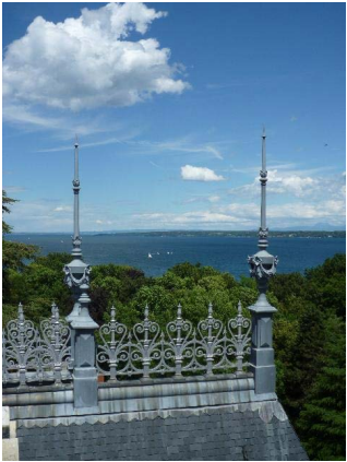
Toit, détail épis de faîtage et crêtes métalliques