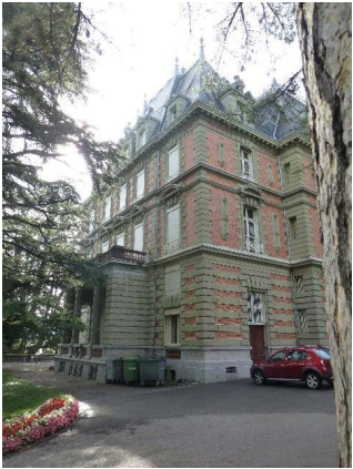
Façades nord et ouest