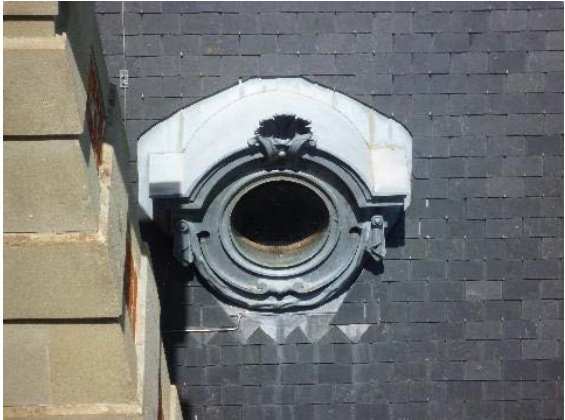
Toit, détail oeil-de-boeuf