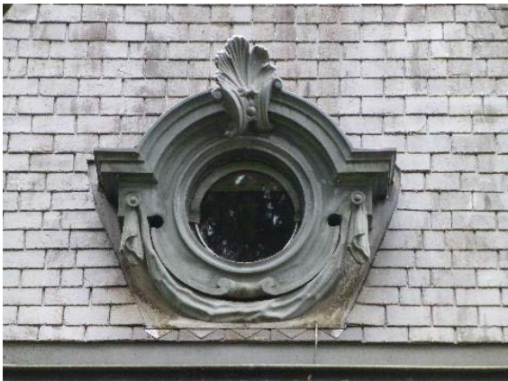
Loge de gardien (bât. 2321), toiture, détail lucarne