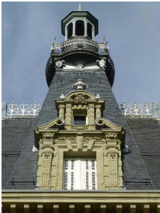
Façade est, toiture, détail lucarne axiale et lanterneau