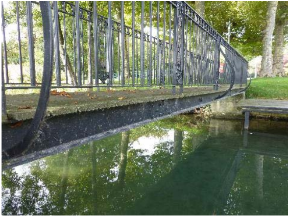
Canal, détail passerelle