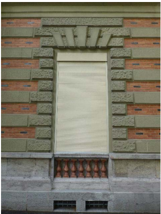
Façade ouest, rez-de-chaussée, détail fenêtre