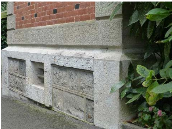
Loge de gardien (bât. 2321), façade nord, détail soubassement