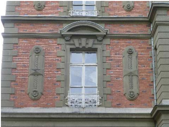
Façade ouest, aile gauche, détail 1er étage