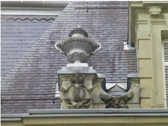
Façade ouest, toiture, détail potiche sur piédestal