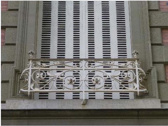
Façade ouest, 1er étage, détail garde-corps de fenêtre