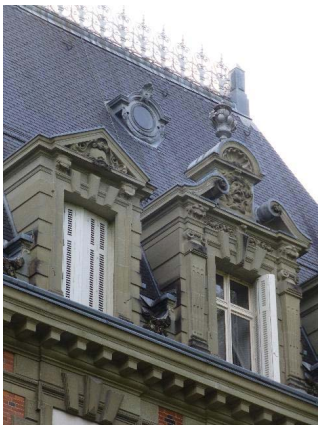
Façade ouest, corps central, toiture, détail lucarnes