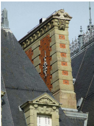
Façade est, toiture, détail souche de cheminée