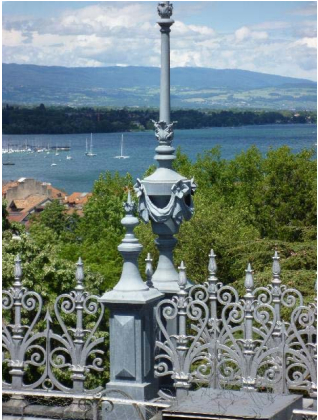
Toit, détail épi de faîtage et crêtes