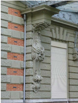
Façade ouest, rez-de-chaussée, détail console supportant marquise