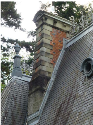
Loge de gardien (bât. 2321), façade nord, détail souche de cheminée