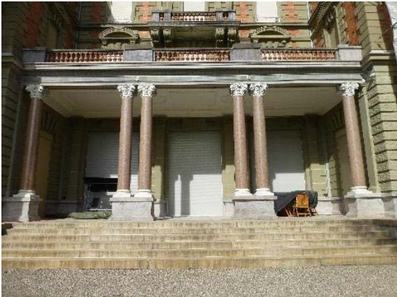
Façade est, rez-de-chaussée, détail portique