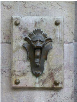
Façade ouest, rez-de-chaussée, détail sonnette entrée