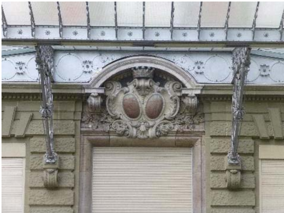
Façade ouest, détail couronnement de la porte d'entrée