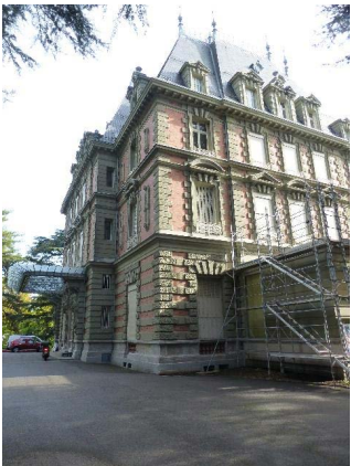
Façades ouest et sud