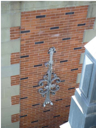
Souche de cheminée, détail appareil et ancre de chaînage