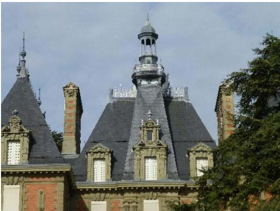
Façade est, détail toiture