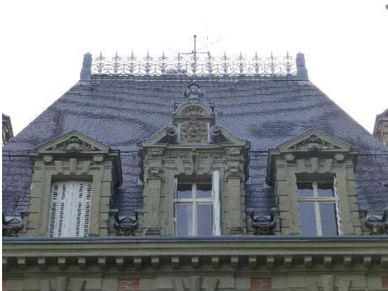
Façade ouest, corps central, détail toiture