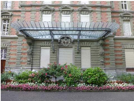
Façade ouest, détail marquise