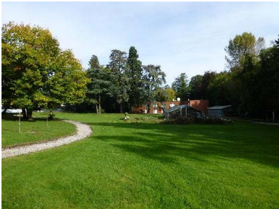
Parc, vue de la zone nord