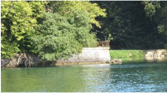
Parc, vue du mur à front de lac