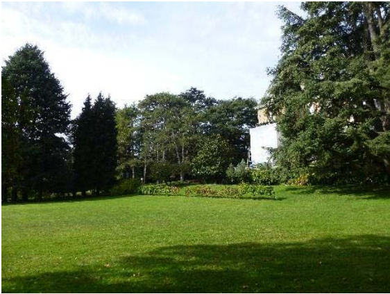
Parc, vue de la zone sud