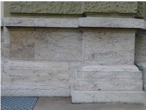
Façade ouest, détail appareil soubassement