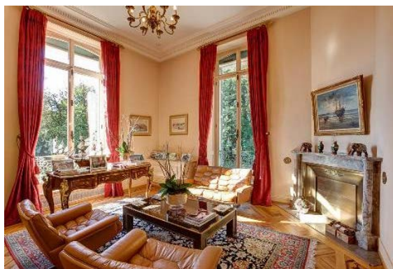
Un autre salon