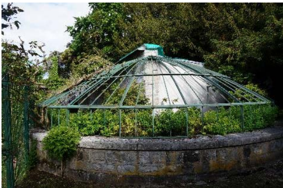
Bât. 257, ancienne serre