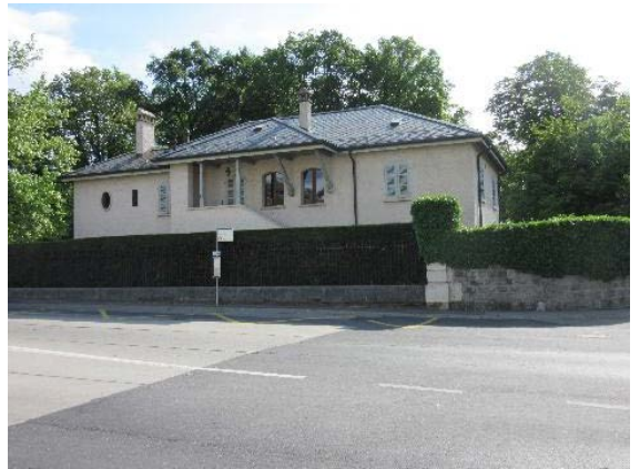
Bât. 1464, façade ouest