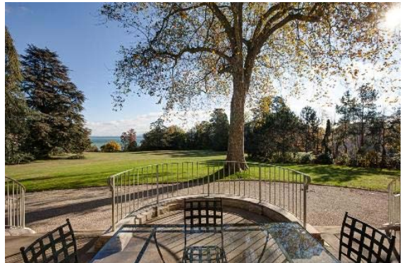
Parc, vu en direction de l'est