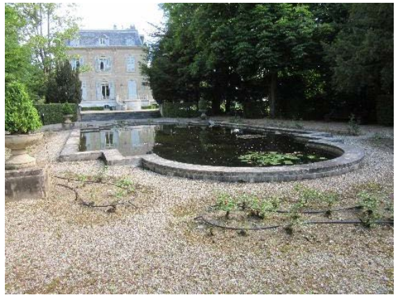
Bassin situé au sud du bât. 254