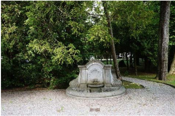
Fontaine et bassin à l'ouest du bât. 254