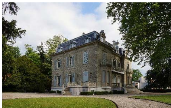
Bât. 254, façades sud et est