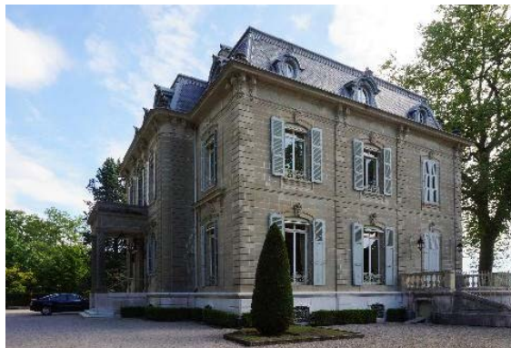
Bât. 254, façades sud et ouest