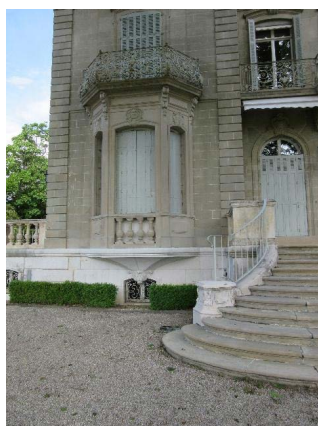
Bât. 254, façade est, détail