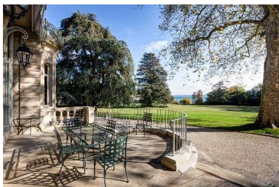
Terrasses et parc, vus en direction du nord-est